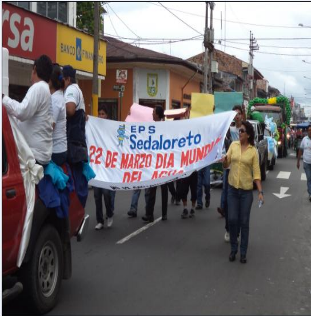
Pasacalle por Día Mundial del Agua